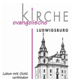
Ev. Kirchenbezirk Ludwigsburg